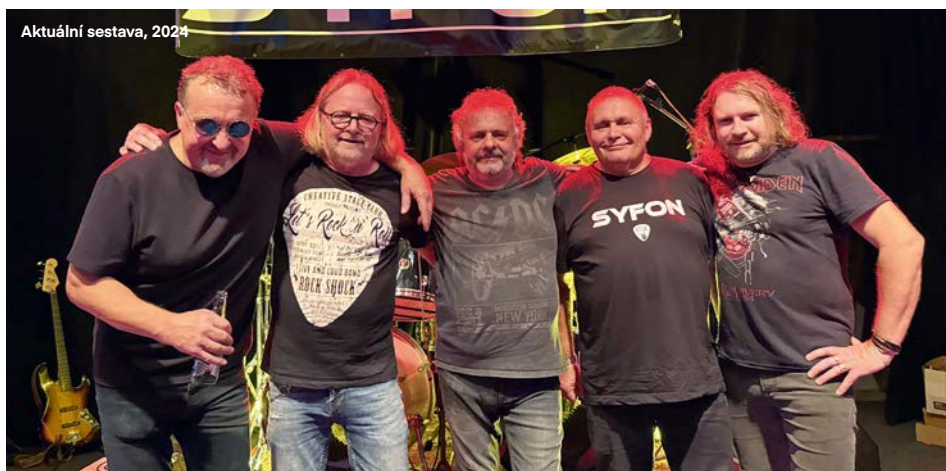
Aktuální sestava, 2024

Od svých začátků kapela navazovala na odkaz hardrockových kapel 70. a 80. let, ale začala produkovat i vlastní tvorbu. Zároveň se přitvrdil sound od původního melodického rocku až k heavy metalu ve stylu Judas Priest, Iron Maiden a podobných světových kapel. Po roce 1989 se někteří členové kapely zaměřili na soukromé podnikání, na muziku nezbýval čas, a tak kapela postupně utlumila a nakonec ukončila činnost. Teprve v létě 2009, 10 let po rozpadu, se tvrdé jádro kapely sešlo na jedné garden party, slovo dalo slovo a nakonec bylo rozhodnuto: Zpátky k nástrojům! Na 15. vánočním bigbitu ve Svitavách znovu vystoupil Syfon ve složení: Petr Horák, Bob Kysilko, Olda Šišmiš, Milan Huschka a Pavel Kalas. Krátce na to ale Pavel v kapele své působení ukončil a místo frontmana kapely zaujal baskytarista Bob Kysilko, část skladeb ale zpívali i Olda s Milanem. Na začátku roku 2020 odešel kytarista Petr Horák a nahradil jej Radek „Bob“ Bednář. Jeho zásluhou kapela ještě přitvrdila ve svém