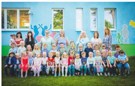
MATEŘSKÁ ŠKOLA LAČNOV ŠKOLNÍ ROK 2023-2024